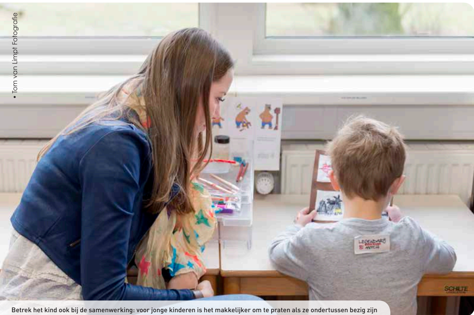
Betrek het kind ook bij de samenwerking: voor jonge kinderen is het makkelijker om te praten als ze ondertussen bezig zijn

ouders. Een ander voordeel hiervan is dat het gesprek meer gaat over wat het kind nodig heeft (de aanpak) dan over wat het kind is of heeft (de diagnose of stoornis). Dit biedt meer perspectief, zeker bij jonge kinderen, want leerkrachten en ouders kunnen dan zelf iets doen om de situatie te verbeteren.